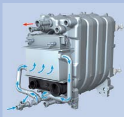
Inox warmtewisselaar in combinatie met het befaamde gietijzeren ketellichaam van Buderus